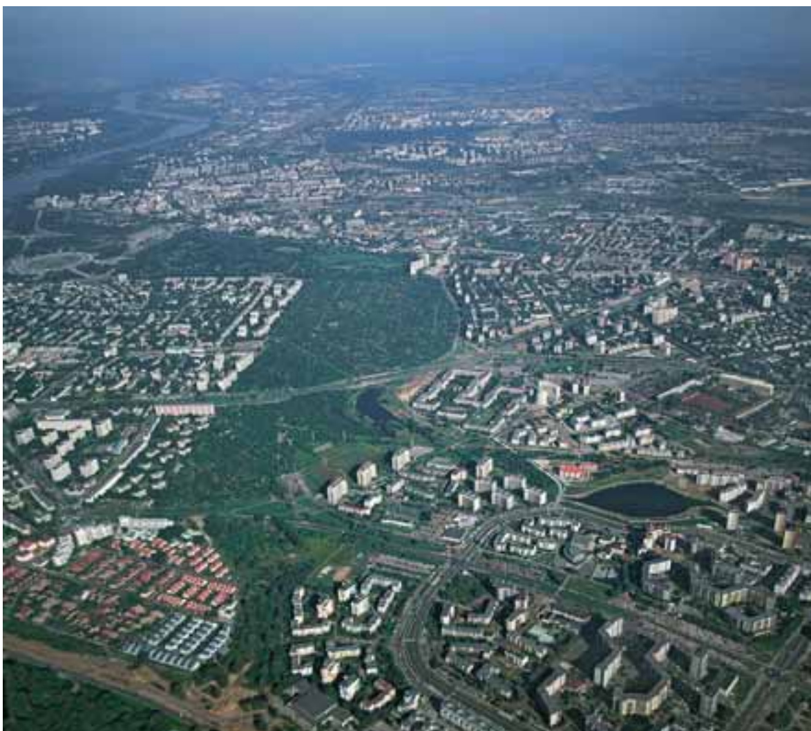
Spojrzenie Warsa, s. 75